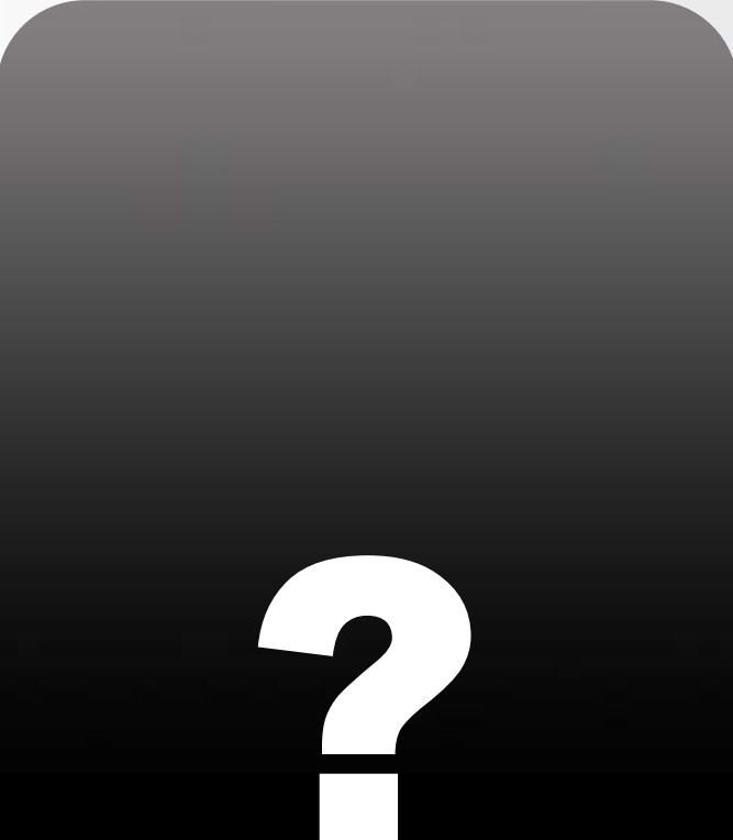
Aún no decide